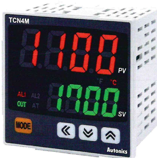
Рисунок 2 – Общий вид приборов серии TCN4