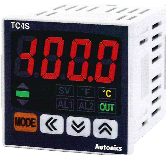
Рисунок 1 – Общий вид приборов серии TC4

Фотографии общего вида приборов приведены на рисунках 1-2.