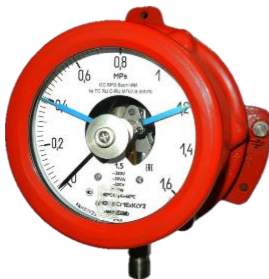
Рисунок 8 – Общий вид манометров ДМ2005Сг1ЕхКс