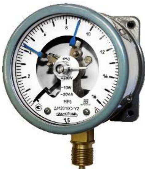
Рисунок 3 – Общий вид манометров ДМ2010Сг