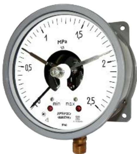
Рисунок 9 – Общий вид манометров ДМ5012Сг