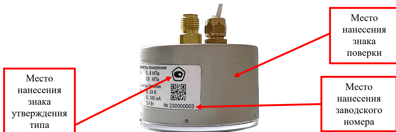
Рисунок 2 – Места нанесения знака поверки на корпус манометра, знака утверждения типа и заводского номера на технической табличке манометра ДМ2015Сг, ДМ5010Сг0Ех, ДМ5012Сг