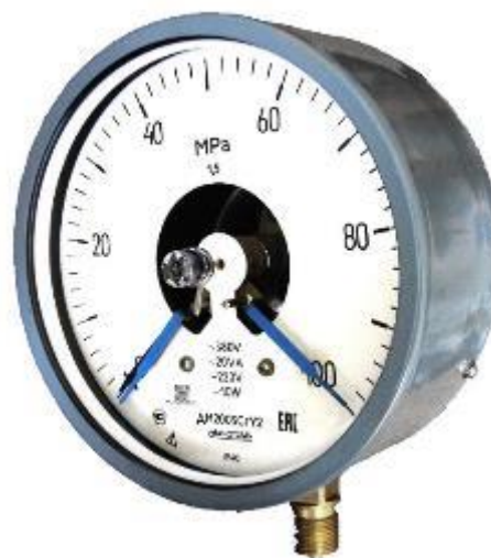
Рисунок 6 – Общий вид манометров ДМ2005Сг