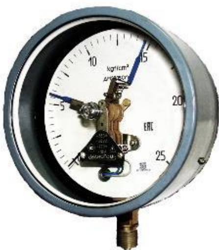
Рисунок 5 – Общий вид манометров ДМ2005Сг-ЭКМ