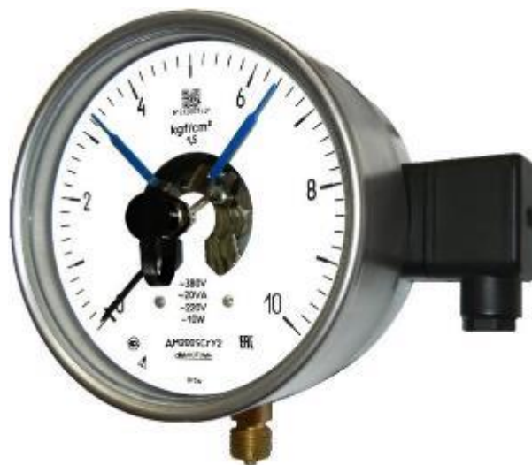
Рисунок 4 – Общий вид манометров ДМ2005Сг