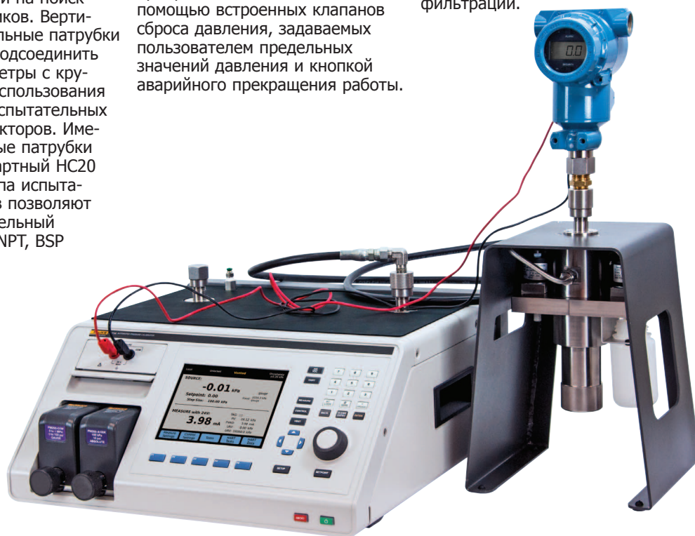
Дополнительная система предотвращения загрязнений помогает поддерживать клапаны прибора 2271A в чистоте и защитить их от попадания пыли.

CPS обеспечивает превосходный уровень защиты, поддерживая однонаправленный поток на расстоянии от контроллера, гравитационный отстойник и двухступенчатую систему фильтрации.