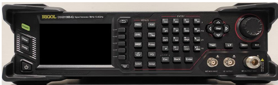
Рисунок 1 – Передняя панель генераторов DSG3000B