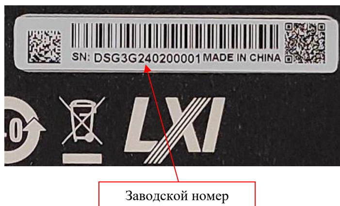
Рисунок 4 – Фрагмент задней панели генераторов DSG3000B с этикеткой