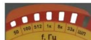
Высокий уровень входного сигнала

а на наушники подается синтезированный звуковой сигнал.