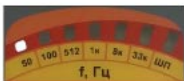
Слабый заряд батарей