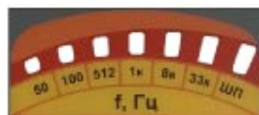
Максимальный заряд батарей