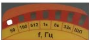
Низкий уровень входного сигнала